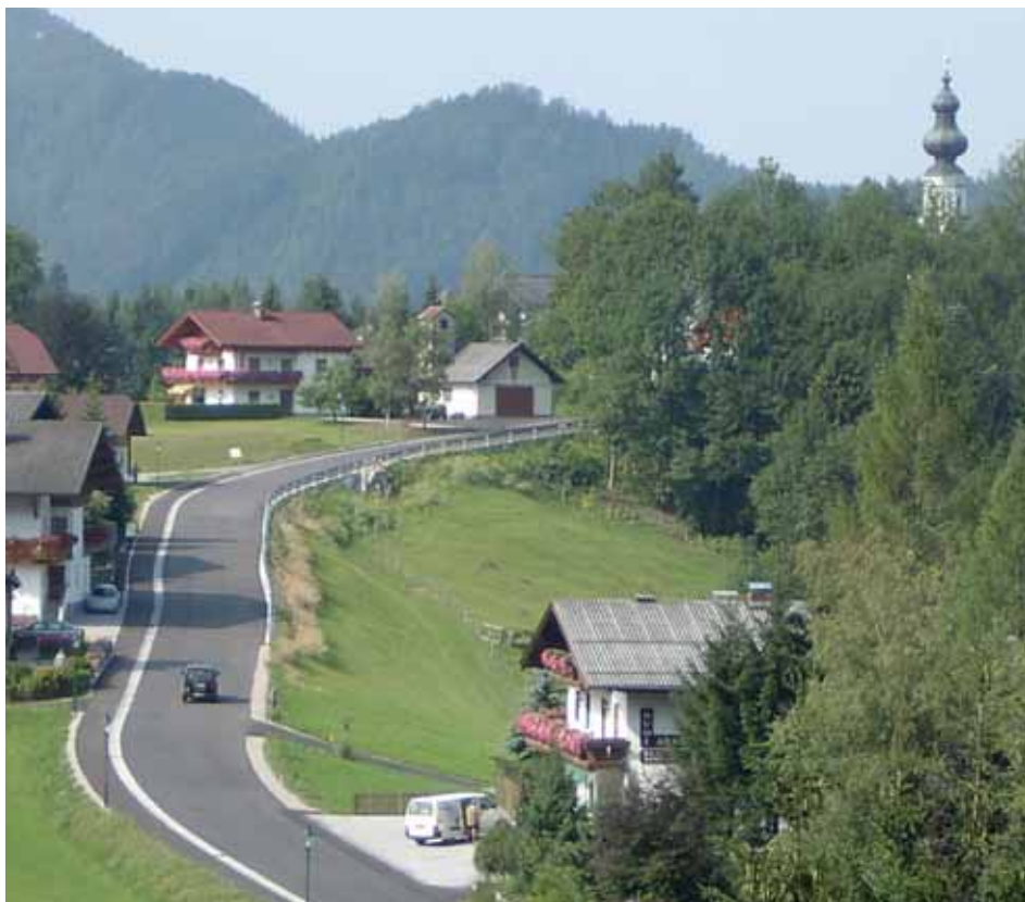
Gehweg entlang der Dorfstraße

Neuer Dorfgehweg an der Dorfstraße, Aufweitung der Engstelle zwischen Gemeindeamt und Kirche, Gehweg Bramsaustraße, Hanithalstraße, Almbachstraße, Perfalleckstraße und vieles mehr!