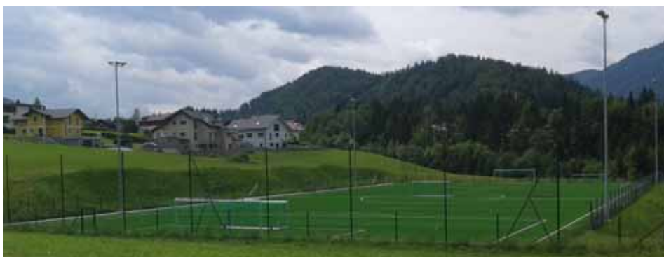
Der neue Kunstrasenplatz von Norden