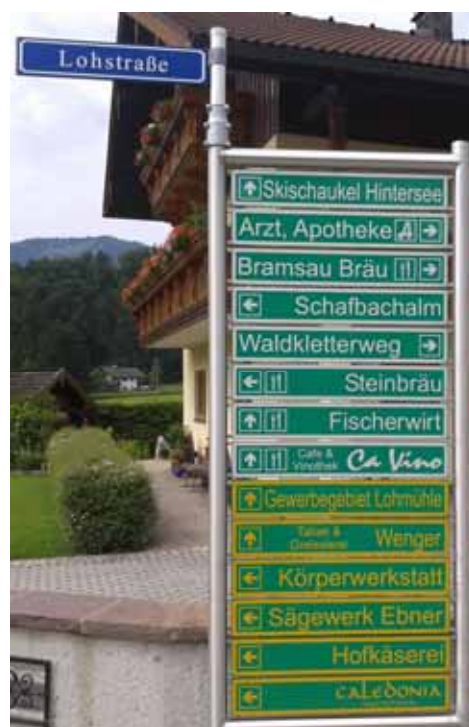
Gewerbebeschilderung mit Straßenschild an der Schmiedhäuslkreuzung

Auf Alleininitiative von Bgm. Ebner wurden Straßennamen in Faistenau eingeführt, sowie eine Gewerbebeschilderung angeboten. Gleichzeitig wurden auch alle Verkehrsschilder samt Geschwindigkeitsbeschränkungen überprüft.