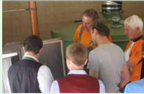
Besucher beim Tag der offenen Tür