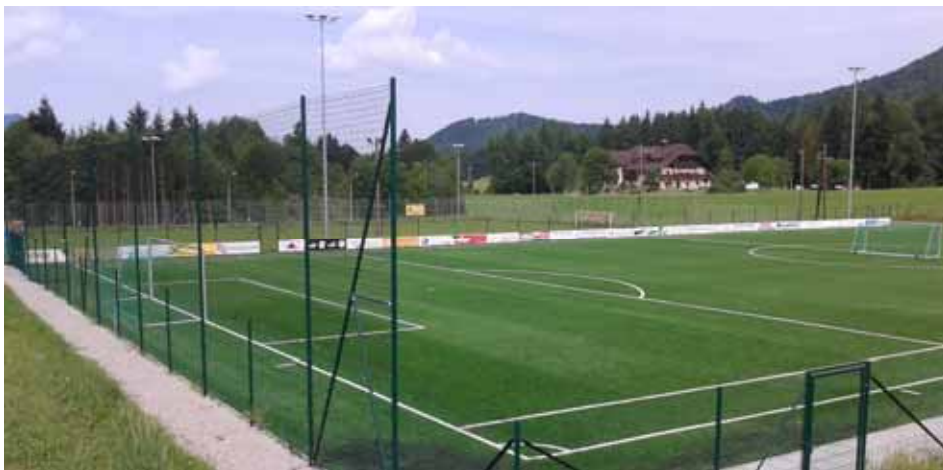
Der neue Kunstrasenplatz von Süden

Zukunftsorientiertes Trainieren am Kunstrasenplatz bei der bestehenden Sportanlage samt Flutlichtanlage und Wasserreservoir für die Beregnung