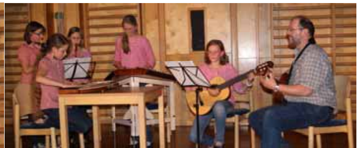
Eindrücke vom Kreativtag 2013 am 7. Mai 2013