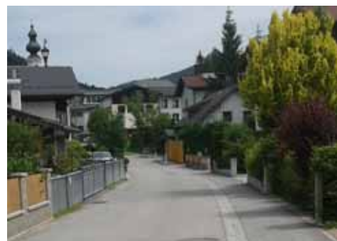
Sanierung Bramsaustraße mit Gehweg