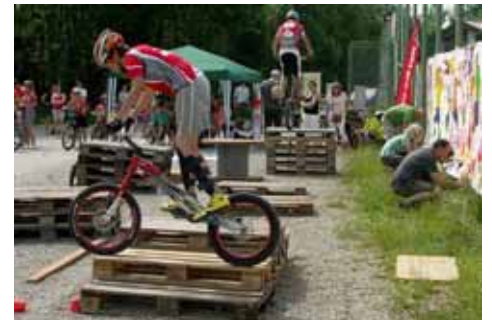
Eindrücke vom 1. Faistenauer Jugendtag

Der Jugendtag wurde von der Gesunden Gemeinde Faistenau im Rahmen des Projektes „Motivation zu Bewegung und Sport“ veranstaltet.