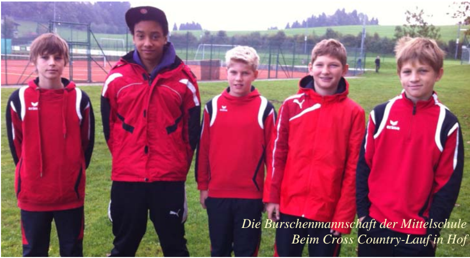
Die Burschenmannschaft der Mittelschule Beim Cross Country-Lauf in Hof