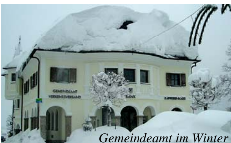
Gemeindeamt im Winter

Es gibt in Faistenau verschiedene private Räumungsdienste. Bitte zeitgerecht organisieren.