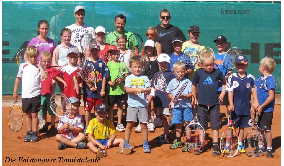
Die Faistenauer Tennistalente